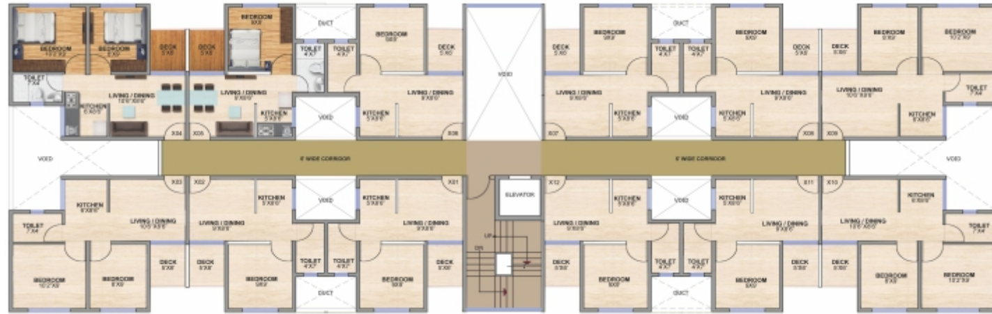
X: FLOOR LEVEL टिपिकल फ्लोर प्लॅन (G+4)