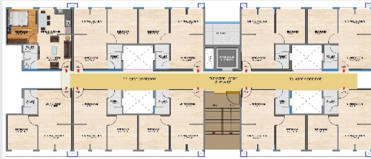
X: FLOOR LEVEL टिपीकल फ्लोर प्लॅन (G+4)