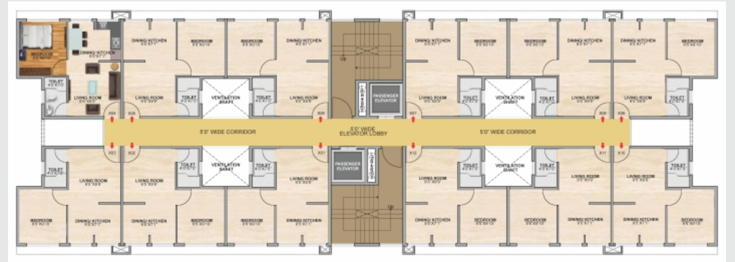
X: FLOOR LEVEL टिपीकल फ्लोअर प्लॅन (G+7)