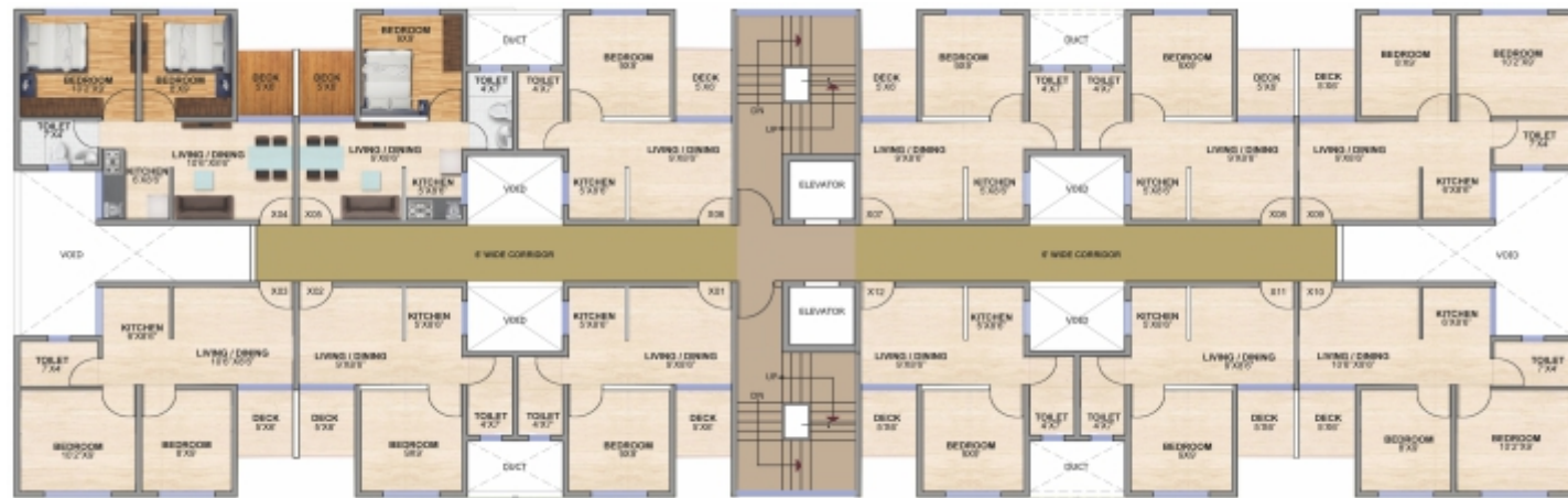
X: FLOOR LEVEL टिपिकल फ्लोर प्लॅन (G+7)