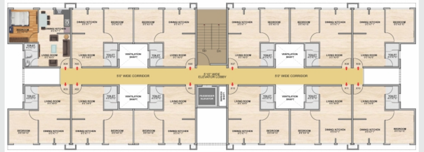
X: FLOOR LEVEL टिपीकल फ्लोअर प्लॅन (G+4)